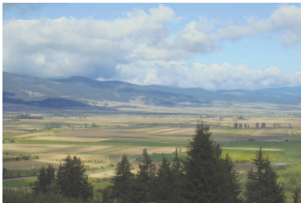
Szégyenkező leányként áll a nyári tájék

Mintha biza 166 év távolából idehallhatnék egyre tompuló éneke a balavásári szüretelőknék. Maradok kiváló tisztelettel. Kelt 2017-ben, az aradi vértanúk napján