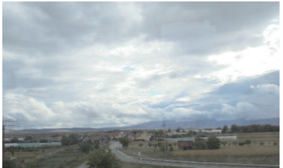
Az ős egének csak borúja van

A pesti egyetemen 1833-ban avatták orvosdoktorrá, ahol elsőként írta és védte meg magyarul Kisdédapolás című disszertációját. Az 1838. évi