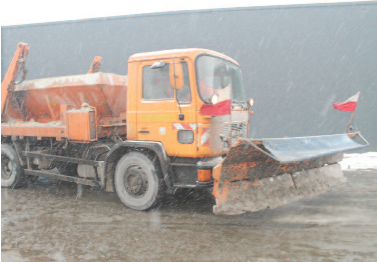
A napokban már havas esőre is lehet számítani a meteorológiai előrejelzések szerint