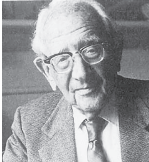
Pólya György (George Pólya) (Budapest, 1887. december 13. – Palo Alto, 1985. szeptember 7.)

1910/11-ben a bécsi egyetemre járt, miközben egy előkelő család gyermekének korrepetálásából tartotta el magát. Visszatérve Budapestre a geometriai valószínűség-elmélet témakörben megvédte matematikai doktoraát Fejér Lipót vezetésével. 1912-ben és 1913-ban a matematika akkori „fővárosá-