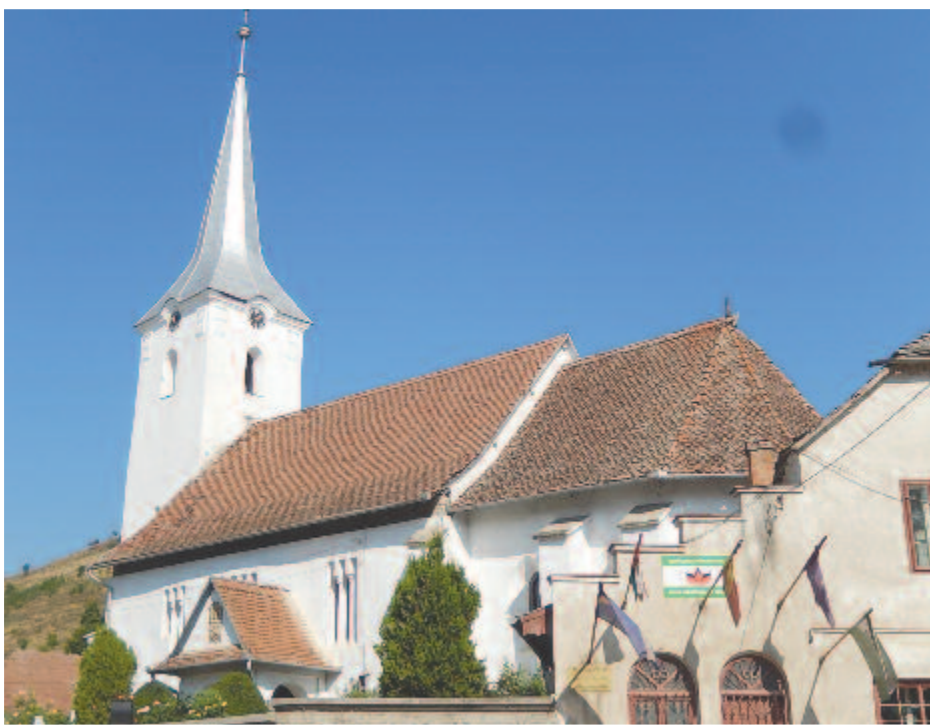
Erdőszentgyörgy pénteken és hétfőn is házigazdája lesz a rendezvényeknek