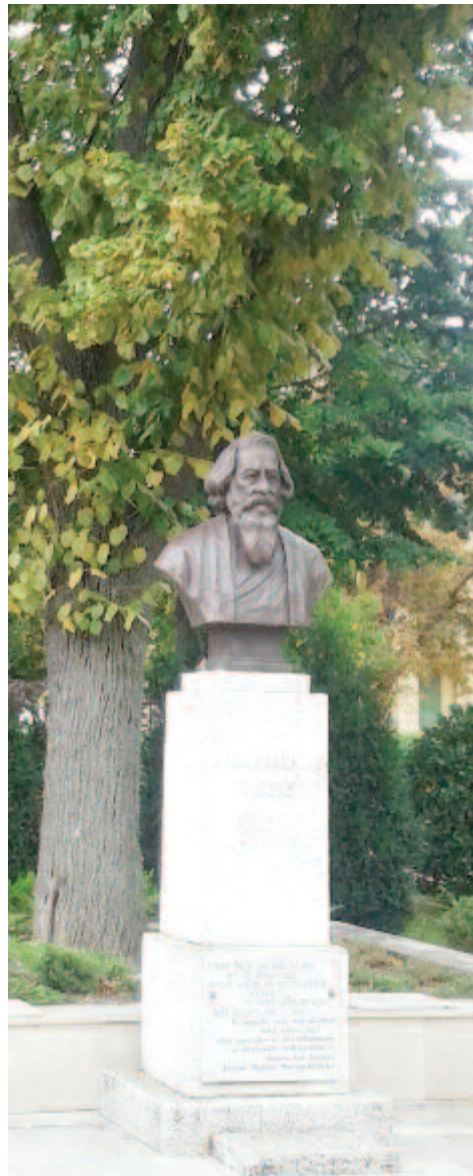
Rabindranath Tagore mellszobra az általa ültetett hársfa előtt, Balatonfüreden

1940-ben – svájci állampolgárként is – úgy érezte, hogy Európában zsidó származása miatt helyzete kritikussá válhat, ezért az USA-ba emigrált. Végül Stanfordban kötött ki, amelynek világhírű egyetemén 1953-ig, nyugdíjba vonulásáig professzorként dolgozott.